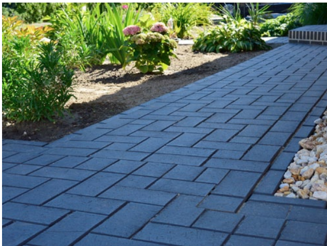
Milano O. setzt unter anderem Gartenwege gekonnt in Szene.

Wer im Außenbereich nicht nur auf verschiedene Werkstoffe, sondern auch auf unterschiedliche Formate